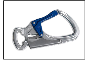
IKV 11 (EN 362:2004-T)