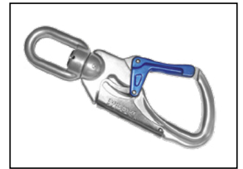
IKV 21 (EN 362:2004-T) mit Fallanzeiger