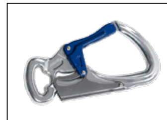
IKV 11 (EN 362:2004-T)