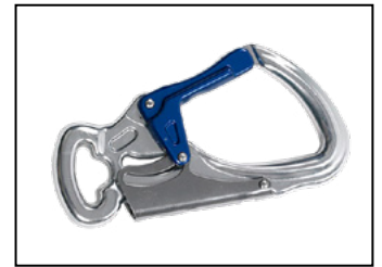
IKV 11 (EN 362:2004-T)